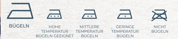
BÜGELN HOHE TEMPERATUR BÜGELN GEEIGNET MITTLERE TEMPERATUR BÜGELN GERINGE TEMPERATUR BÜGELN NICHT BÜGELN