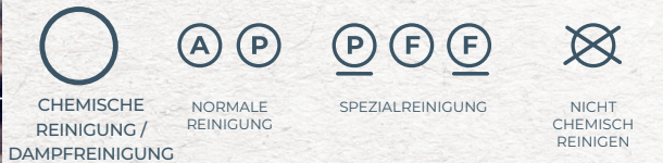
CHEMISCHE REINIGUNG/DAMPFREINIGUNG NORMALE REINIGUNG SPEZIALREINIGUNG NICHT CHEMISCH REINIGEN

Die Buchstaben sind hauptsächlich für den chemischen Reiniger. Sie geben das zu verwendende Lösungsmittel an. Der Strich unter dem Kreis bedeutet: geringe Beladung, hohe Flotationsrate, wenig mechanische Bewegung, kurze Reinigungs-, Spül- und Schleuderzeiten und vor allem: kein Wasser hinzufügen.