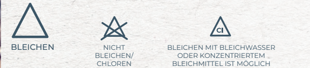
BLEICHEN NICHT BLEICHEN/CHLOREN BLEICHEN MIT BLEICHWASSER ODER KONZENTRIERTEM BLEICHMITTEL IST MÖGLICH

Das Zahlensymbol in der Wanne gibt die maximal zulässige Temperatur an; Diese niemals überschreiten. Zu den normalen Waschprogrammen gehören auch Energie-, Spar- und Halbprogramme. Bei Knitterschutzprogrammen: Die Waschmaschine mit der Hälfte des maximalen Gewichts beladen. Wollwäsche in der Waschmaschine: Nur mit Programmen, die vom Internationalen Woll-Sekretariat (IWS) genehmigt wurden; Beladung von 1/3 bis 1/4 des maximalen Gewichts.